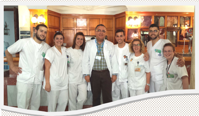
DESPIDIENDO NUESTRA ANTIGUA BARRA DE CAFETERÍA

Le damos nuestra bienvenida y esperamos que sea acogida por todos con el valor de la Hospitalidad